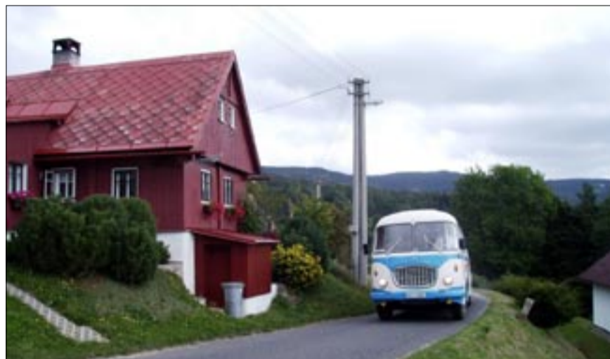
Krásami Tanvaldska cestující proveze také historický autobus.