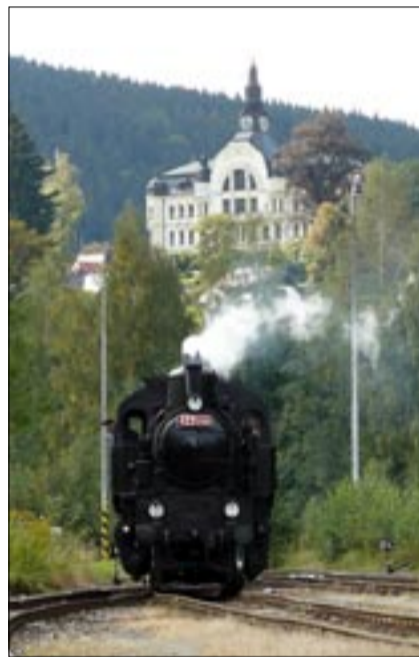
Návštěvníci letošních tanvaldských slavností se opět mohou těšit, že se svezou vlakem, taženým parní lokomotivou.