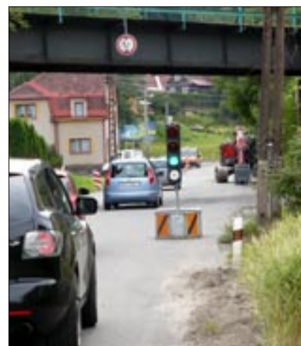
Zastávek na semaforech si řidiči užijí minimálně do října (pokud budou mít opravy hladký průběh).

Podle manažera projektového týmu Jana Stacha by opravy silnice měly skončit v říjnu letošního roku. Dokončení rekonstrukce už by se mělo obejít bez větších objížďek. „Dlouhodobé objížďky řidiče nečekají. V současné době je ve stadiu předjednání krátkodobá úplná uzavírka pro pokládku vozovkového krytu v celé šíři po jednotlivých úsecích. Zatím není nic dohodnuto (Pozn. red.: před uzávěrkou zpravodaje.), rozhodující bude stanovisko stavebního úřadu,“ uvedl Jan Stach. Na jízdu bez semaforů si řidiči budou muset počkat. „V současné době jsou na celé stavbě čtyři semaforové soupravy. Spíše se dá říci, že jeden ubude, ale z dalšího úseku se postupem stavebních prací stanou dva kratší,“ doplnil Stach. Během léta probíhaly práce na objektech odvodnění a zdí. Na místech, kde už bylo vybavení komunikace hotovo, proběhla pokládka