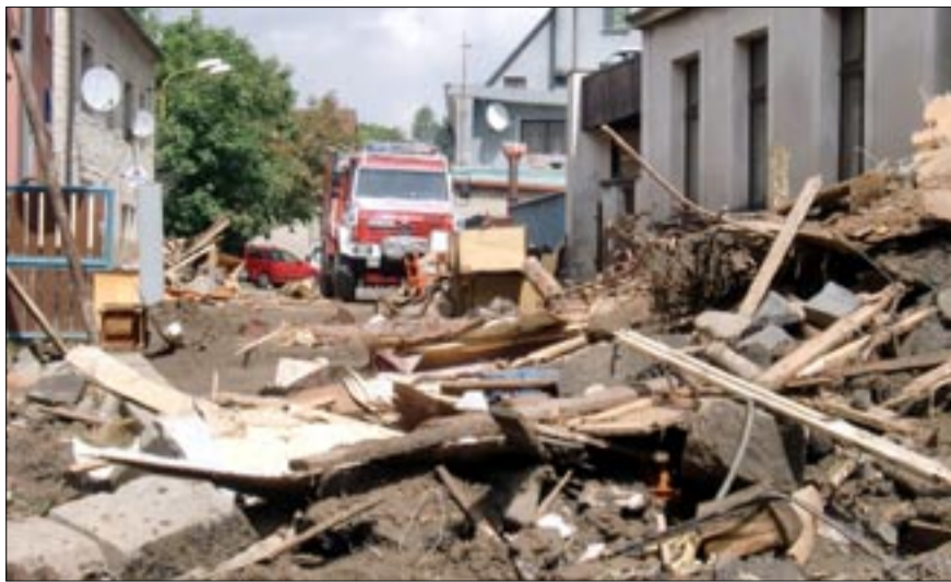
Tanvaldští hasiči přijeli pomáhat povodní postižené Chrastavě.

Nevlídou tvář ukázalo počasí ve dnech 7. a 8. srpna. Nejdrtivěji v Libereckém kraji. Katastrofální škody na Frýdlantsku a Chrastavsku musel zaznamenat každý, kdo sleduje pravidelně televizi. V oblasti Jizerských hor a Krkonoš spadlo během 48 hodin od 100 až do 280 litrů vody na metr čtvereční. Kamenice v Plavech těsně překročila 3. stupeň povodňové aktivity, výrazněji ho přesáhla Mumlava v Harrachově i Jizera. Vodní toky v Tanvaldu se pohybovaly na hranici dvojky, tedy ve stavu pohotovosti. K evakuaci jsme našťastí nemuseli sáhnout. Jak by se však situace vyvíjela, nebýt přehrad v Josefově Dole a na Souši, které dlouhé hodiny zdržovaly vodu na minimálním průtoku? Zatímco Horním Tanvaldem v sobotu odpoledne protékalo přibližně 40 m 3 /s, bez přispění Josefodolské nádrže by se tudy ve špičce valilo až 110 m 3 /s, což je již mimo kapacitu Kamenice. Ohroženy by byly všechny domy podél břehu z Josefova Dolu až po Tanvald. Z provozu by byla vyřazena silnice i všechny mosty s pravděpodobně nenávratným poškozením. V Horním Tanvaldě by se evakovala celá oblast od restaurace U Dubu až po Truhlárnu. Bezprostředně ohrožena by byla i železniční trať a provoz by zde musel být dozajista přerušen. Řeka Desná kulminovala na 30 m 3 /s. Bez vodního díla Souš by průtok činil zhruba dvojnásobek a to by znamenalo přede-