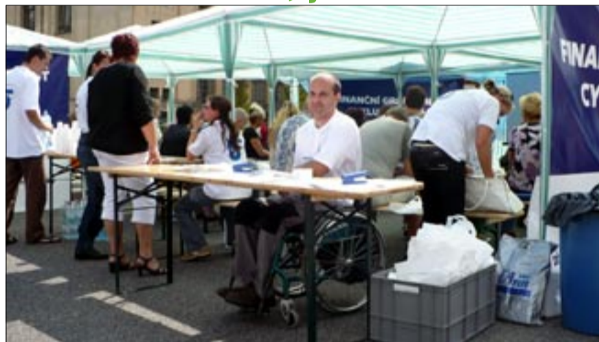
Na centrálním parkovišti se v srpnu uskutečnil seminář občanského sdružení Most ke vzdělání, které podává pomocnou ruku nezaměstnaným.

Jak nakládat s rodinným rozpočtem, jak se vyhnout exekucím a co si počít, pokud už exekutor takřkajíc klepe na dveře, to se mohli dozvědět návštěvníci semináře o. s. Most ke vzdělání, který odstartoval 5. srpna na tanvaldském centrálním parkovišti. „V době hospodářské krize a zvyšující se nezaměstnanosti roste počet osob, které se potýkají s nedostatkem prostředků, zadlužováním a následnou špatnou finanční situací. Zejména pro ně připravil Úřad práce v Jablonci nad Nisou projekt Finanční gramotnost,“ informoval analytik trhu práce Michal Holý. Cyklus seminářů se postupně koná v šedesáti městech Libereckého kraje. Přednášky jsou určeny uchazečům a zájemcům o práci i