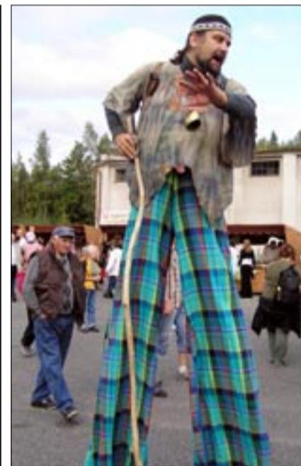
Pro nejmenší je stejně jako v loňském roce na slavnostech připraveno pouliční divadlo.