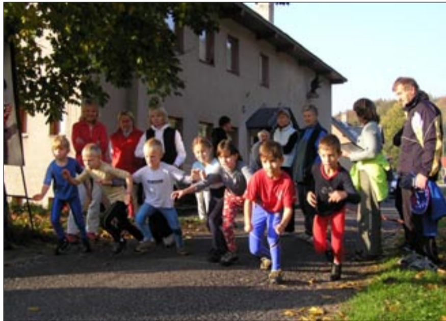
Běžci všech věkových kategorií mají možnost na Českém Šumberku v říjnu závodit.

Tělocvičná jednota Sokol Český Šumberk za účasti sponzorů vás srdečně zve na 18. ročník Přespolního běhu Českým Šumberkem.