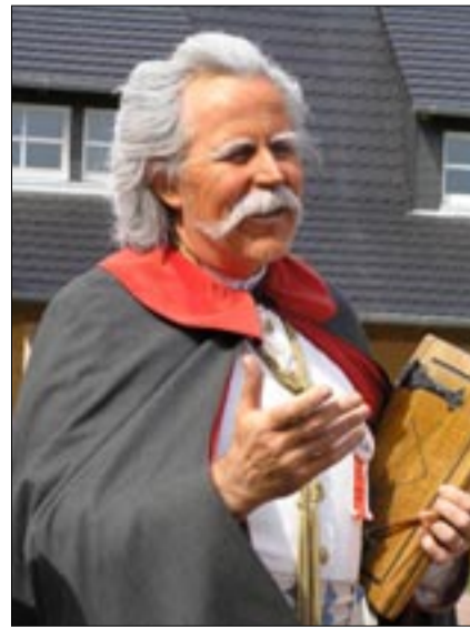
K tanvaldským seniorům promlouvá sám Krabat a vítá je (jak jinak) než chlebem a solí.

Zastávkou na oběd se stala Rybářská restaurace Dr. Zeldera v Neudorfu – Klösterlichu. Prosperující rodinný podnik