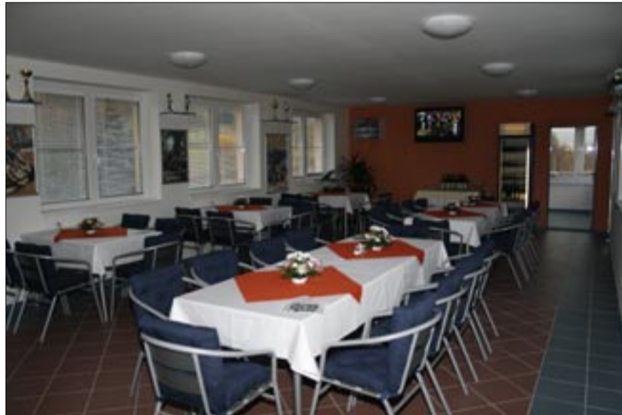
Sport bar je pro sportovce i nespportovce, turisty i domácí otevřen denně.

Pro umocnění pohodové atmosféry je restaurace vybavena dvěma plazmovými televizemi se satelitním příjmem v českém jazyce, na kterých můžete sledovat sportovní přenosy, seriály, filmy a vše, co nabízí programová volba. Mimo jiné je zde také možnost DVD projekce, případně připojení PC s vlastní prezentací. To je obzvláště výhodné pro prezentaci firem.