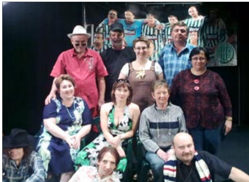
Oblíbenou hru, kterou má v repertoáru i řada profesionálních souborů, si tentokrát vybrali tanvaldští ochotníci. Přijďte se podívat, jak si s touto hospodskou tragikomedii poradili.

Jedná se o úspěšnou maďarskou komedii o splněných i nesplněných snech, o touze po svobodě, o Hrabalovských tématech, o hospodských štangastech a o tom, jak se prostředí v této hře – vesnická hospoda – úžasně podobá českému, moravskému a podobně... Možná, že jsme s tímto vědomím začali tuto hru studovat. Ale postupem zkoušek jsme se dostali k poznání, že nechceme lidi zatěžovat zbytečným patosem a melancholií, ale že je spíš chceme našim představením pobavit a rozesmát, odreagovat je od jejich všedních starostí. Mnohokrát