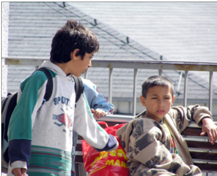
Spokojení školáci na lavičce, kde asi jednou v dospělosti zakotví...