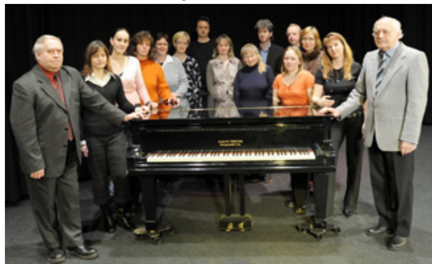
Již šedesát let se mohou vzdělávat v hudebních oborech, tanci a výtvarné výchově pod vedením zkušeného kolektivu učitelů děti z Tanvaldu a okolí.

Základní umělecké školy v Tanvaldě je šedesát let. Pro někoho je to v životě doba dlouhá, pro někoho krátká. V každém případě lze konstatovat, že podle zápisů v kronice školy je to doba, po kterou škola obohacovala kulturní dění v Tanvaldu a jeho okolí. Školou prošla spousta žáků, kteří ke svému talentu museli přidat píli a vytrvalost i trpělivost a podporu rodičů. Učitelé v uměleckých školách se snaží u každého jednotlivce nejen nacházet cesty k osvojení praktických